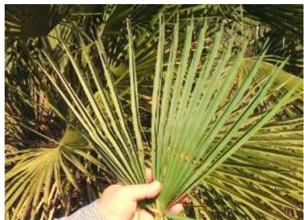
Atacs de Paysandisia a les fulles i al tronc

En la seva fase adulta (visible entre finals de maig i començaments d'octubre), és una papallona diürna de mida gran, amb un marcat dimorfisme sexual (8 cm d'envergadura els mascles i entre 9-11 cm les femelles); les ales anteriors són de color entre gris i verd oliva en l'anvers. Les ales posteriors són ataronjades amb una banda negra que conté entre 5 i 6 taques blanques.