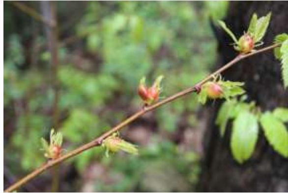
Gal·les causades per vespeta del castanyer