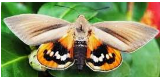
Adult de Paysandisia archon

En cas de detectar atacs produïts per aquest insecte en el medi forestal, haureu de comunicar-ho a l'adreça de correu electrònic següent: sanitatforestal.daam@gencat.cat .