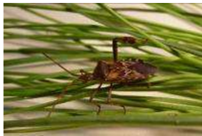
Adult de L. occidentalis

En aquests moments, s'està treballant amb centres d'investigació per trobar mètodes de control específics que siguin efectius per controlar aquesta espècie.