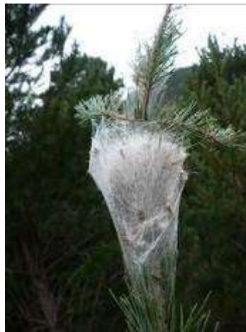
Bossa amb colònia d'erugues