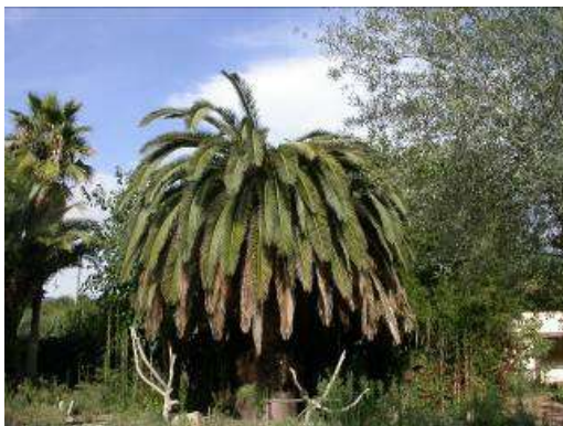
Síntoma típic d'atac de Rhynchophorus ferrugineus

Detectar els inicis de l'atac no sempre és fàcil. Els símptomes externs es manifesten amb un assecament de les fulles centrals de la corona. Quan avança l'atac, les fulles centrals s'esgrogueeixen i es marceixen, de manera que en poques setmanes la pràctica totalitat de la corona es veu afectada, cosa que origina la mort de la palmera.