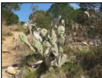
Figuera de moro afectada

Aquests mesos de més calor, a les zones urbanitzades properes a poblaments d' Opuntia maxima , hi pot haver emergències de mascles alats que poden ocasionar molèsties en entrar a les cases. Cal especificar que aquests mascles alats no constitueixen un problema de salut pública, ja que manquen d'aparell bucal i, per tant, no són capaços de provocar picades. Aquestes emergències tendeixen a disminuir a mesura que les figueres de moro van morint.