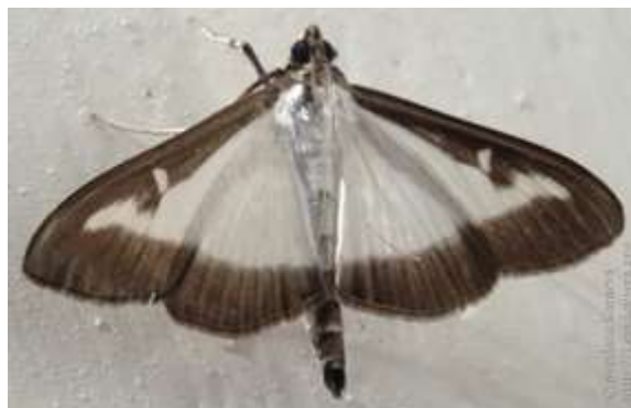
Forma més comuna de la papallona del boix

Durant el mes de setembre, es torna a observar un augment de població de papallones adultes que s'estendrà durant tot el mes de setembre, octubre i primera setmana del mes de novembre.