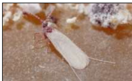
Mascle adult de la caparreta vermella

Si aquesta plaga està localitzada en jardins i parcs i es vol preservar la planta de la plaga, es poden dur a terme les pràctiques següents: