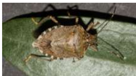
Adult d' H. halys

De moment, se situa a l'entorn urbà i àrees verdes sense causar danys aparents. El seu abast continua avançant. Durant aquests primers mesos de primavera, els adults surten de la hibernació cap a les plantes hoste, on continuaran el seu desenvolupament.