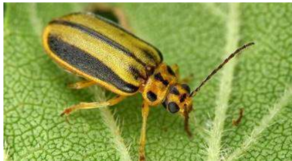
Adult de galeruca

Tractaments fitosanitaris: en el cas que s'hagi de reduir la plaga, es pot aplicar un primer tractament durant la primavera, quan els adults hivernants van cap a la copa de l'arbre, i un segon tractament entre mitjan juny i juliol, en el moment en què neixen les larves. En el cas d'aplicar un tractament insecticida, cal utilitzar preferentment insecticides que respectin la fauna auxiliar.